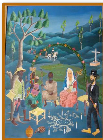
Les Dieux Vodous se penchent sur le Destin d'Haïti, Huile sur toile, 1991, © Cameau Rameau