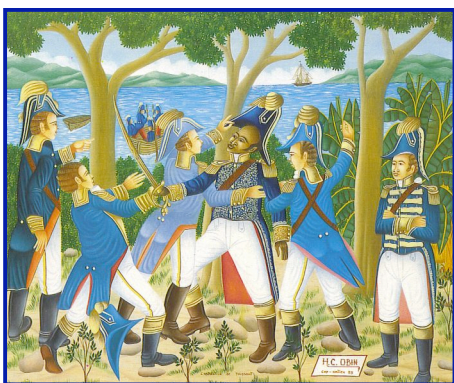
Arrestation de Toussaint-Louverture, le 7 juin 1802 à Saint-Domingue © Henri-Claude Obin, 1992.

Métro: Montparnasse Bienvenüe (ligne 4-6-12-13) & Edgard Quinet (ligne 6)